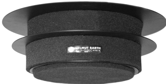
Abb. Ausführung in Schwarz.. ähnlich